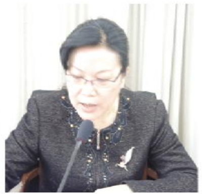
社省委副主委侯华梅作宣传工作报告