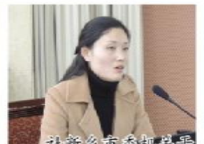
社新乡市委机关报郭孟小鸣作《党报宣传无难事，只需多用一份心》讲座