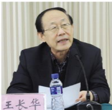
社省委副主委王长华作总结讲话