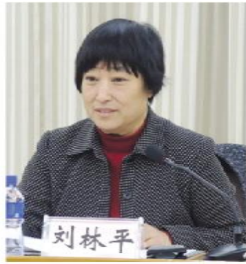
社省委副主委刘林平主持研讨会